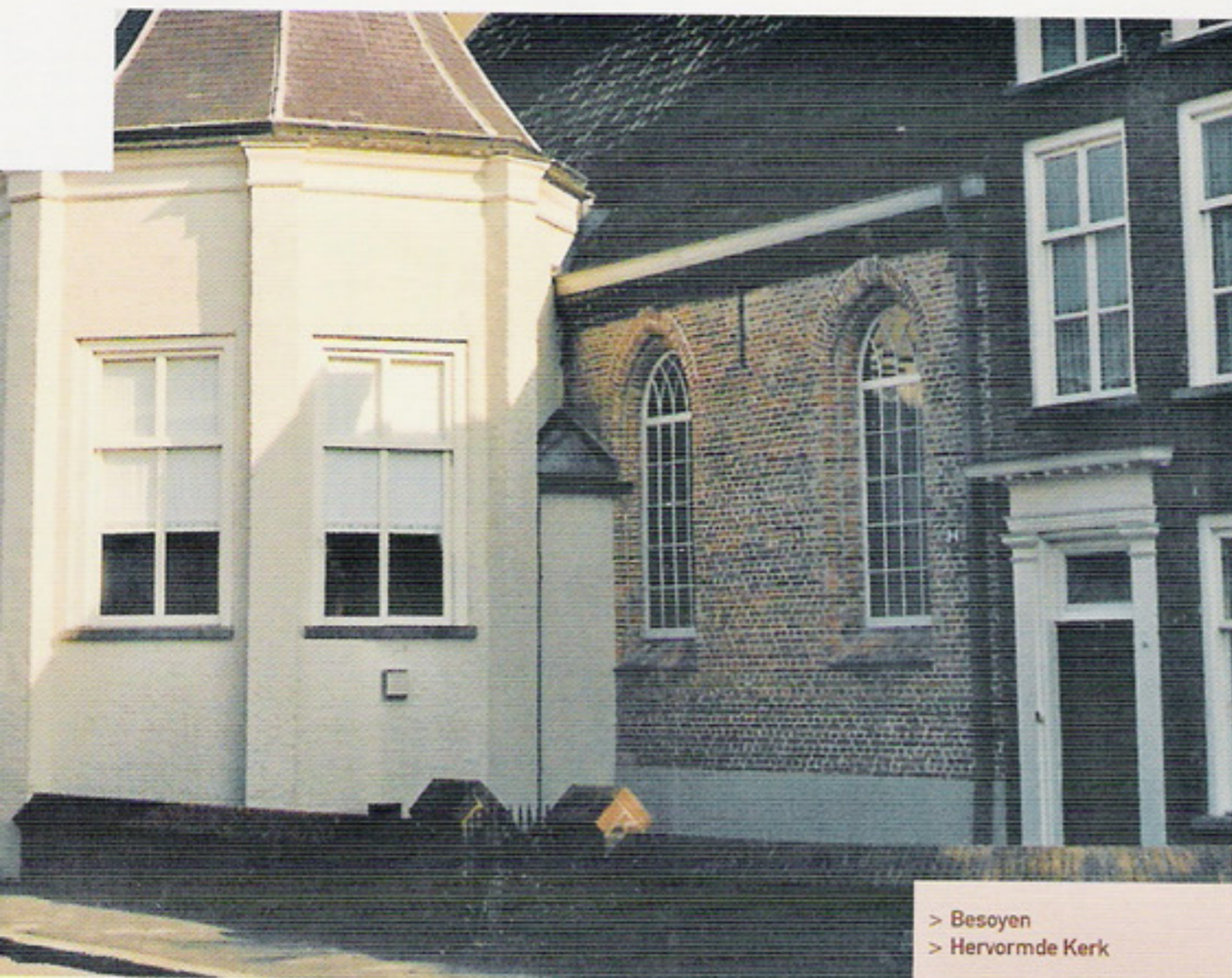
> Besoyen > Hervormde Kerk

Wie in Nederland per fiets of met de auto een stad of een dorp nadert, ziet vaak al van ver de toren van een kerkgebouw boven de rest van de omgeving uitsteken. Een markant punt dat richtinggevend is voor wie langs de wegen trekt. Van oudsher is de kerk een beeldbepalend element in het dorp of de stad. In de Middeleeuwen speelde het dagelijks leven zich af rond de kerk: er werd markt gehouden en recht gesproken. De kerk zelf vormde het middelpunt van het gelovig leven. Als de gemeenschap zich uitbreidde, bouwde men het woongebied rond de kerk verder uit: de kerk stond midden in de samenleving. Daar staan de vele -vaak monumentale- kerkgebouwen nog altijd. En hun missionaire uitstraling raakt niet alleen de gelovige kerkgangers, maar alle mensen die leven in de schaduw van die vaak eeuwenoude muren.