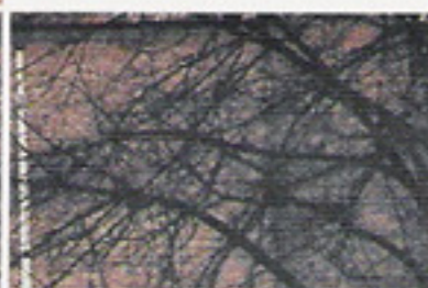
> 's-Hertogenbosch > Hervormde Kerk