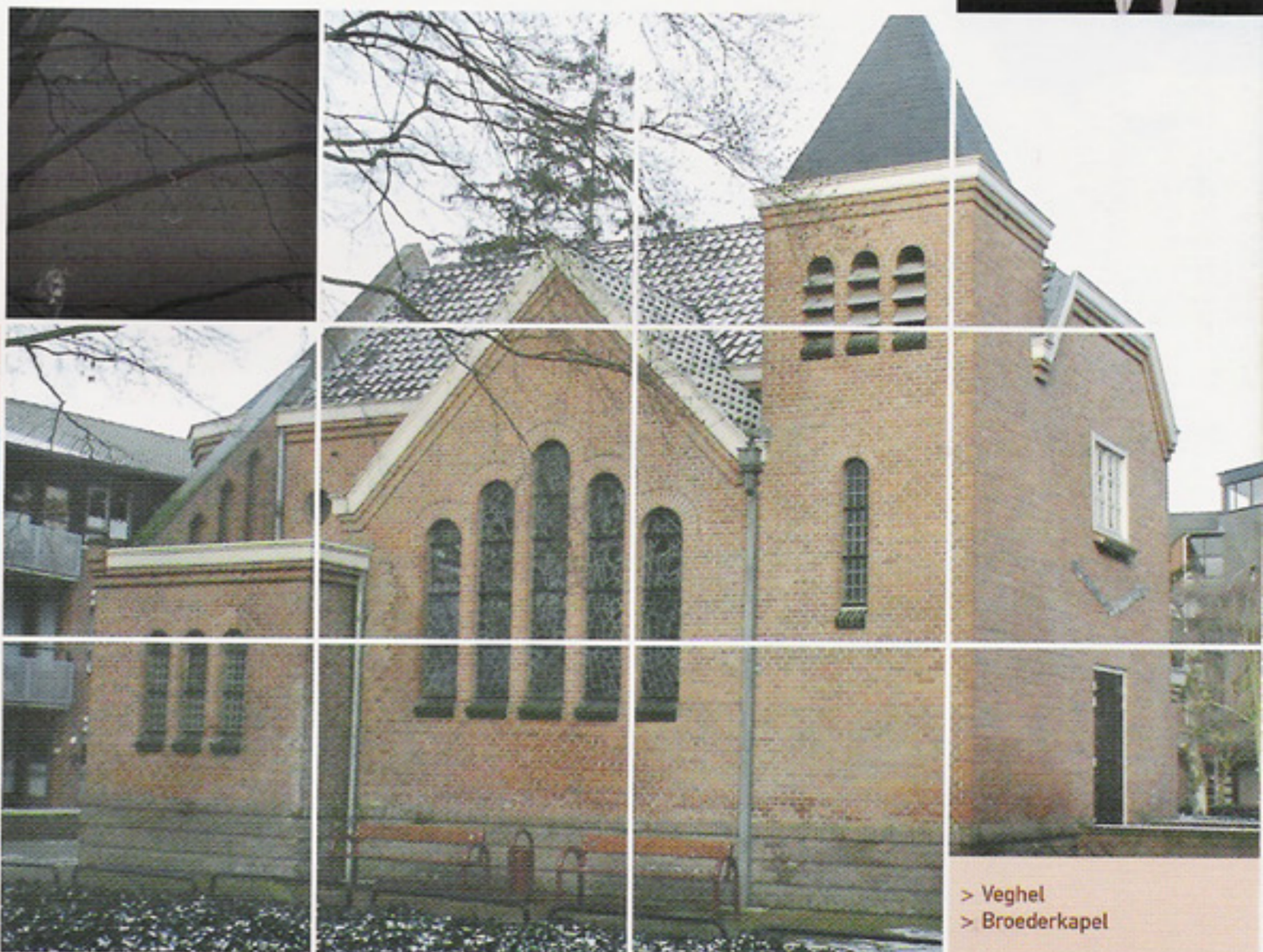
> Veghel > Broederkapel