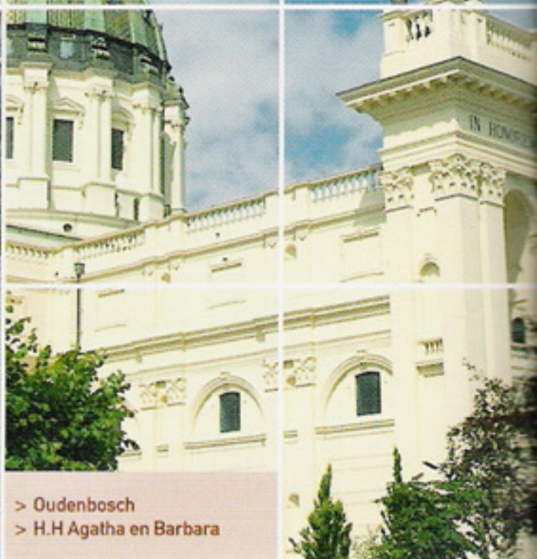
Oudenbosch Kapel Saint Louis