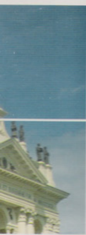
> Eethen > Hervormde kerk